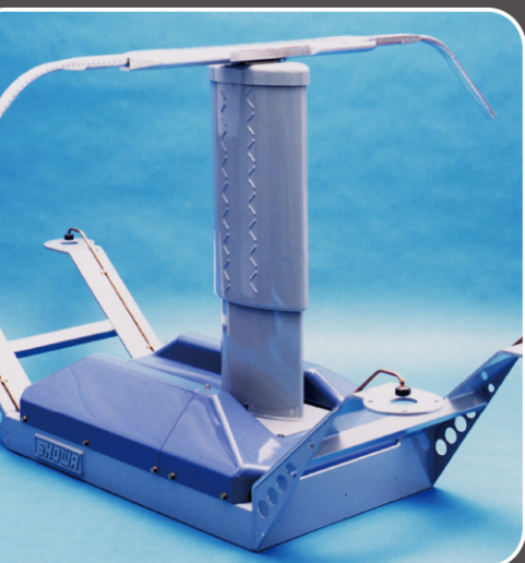
500系新幹線用翼型パンタグラフ

鋭い鼻先が特徴的で、今も大人気の新幹線、500系。 あの形は、ある“生き物”にヒントを得て作られていた。 現代の科学技術に活かされる、生物の形とは？