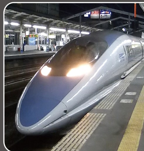
停車中の500系新幹線

500系新幹線のとがった先頭車両やパンタグラフには、“生き物”の形が取り入れられ、より早くより静かに走ることができるようになりました。 最先端の科学技術に活かされた、生物の形についてお話しさせていただきます。